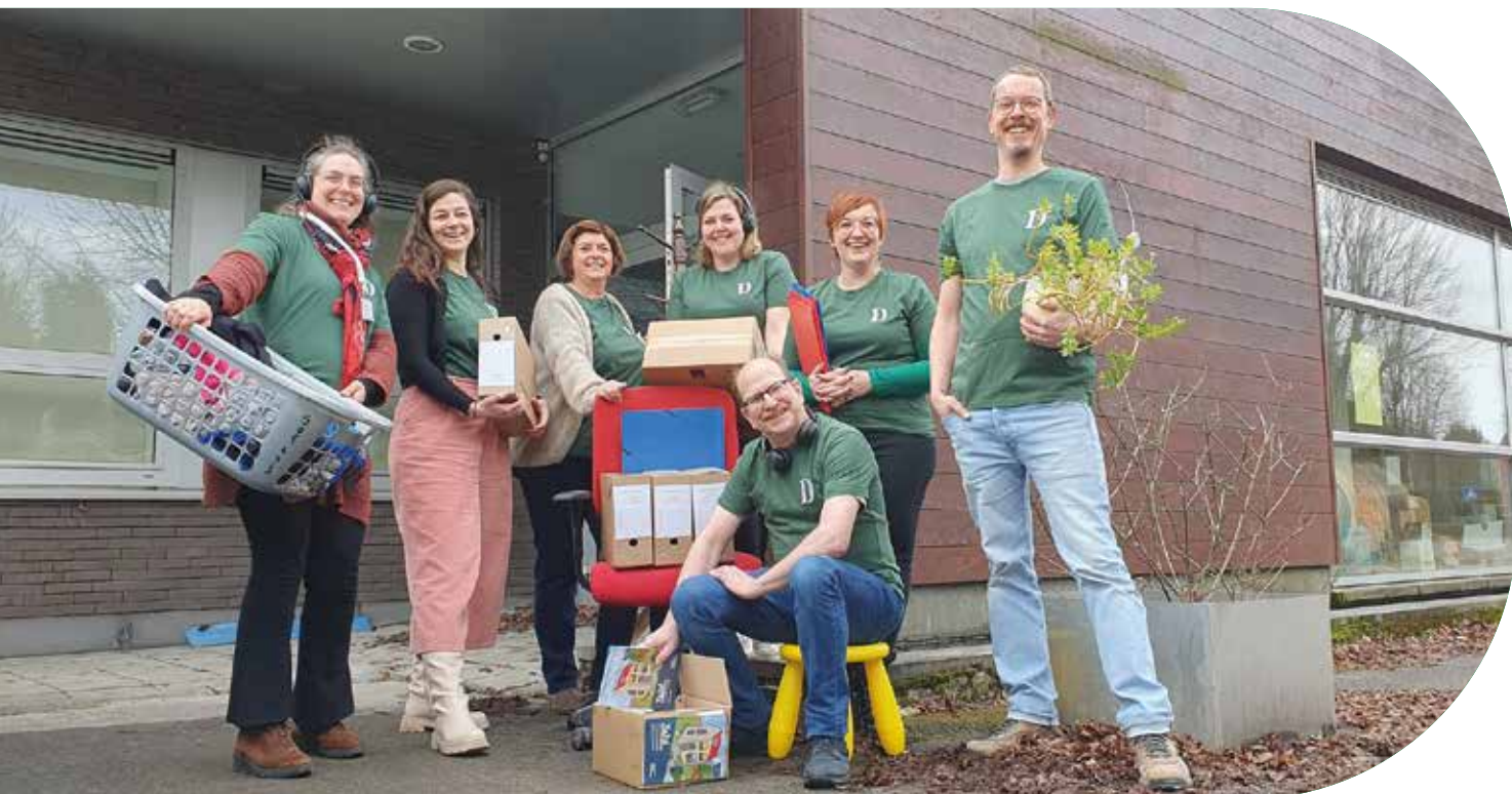
Het hele team van het Sociaal Huis zit straks samen in één kantoorgebouw.